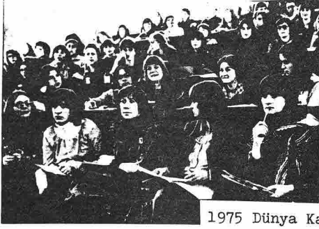
1975 Dünya Kadınlar Kongresi