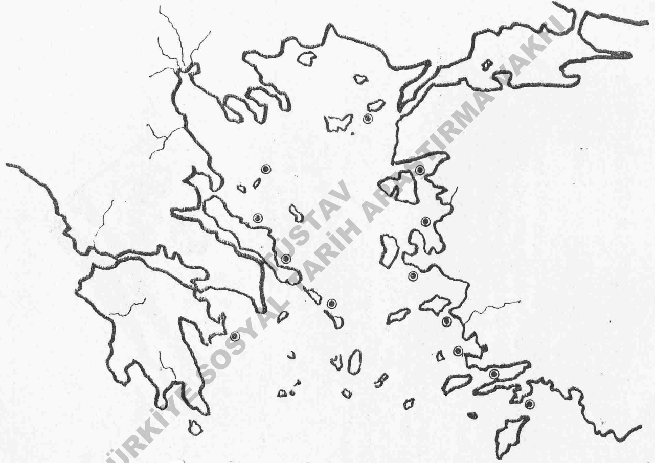
● EGE DE FOKLARIN YAŞAMA ALANLARI.